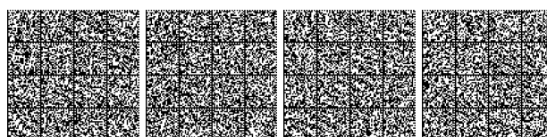
Tabella V.9-2: Compartimentazione