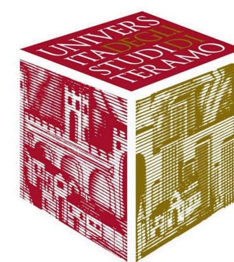
TAVOLA ROTONDA I RAPPORTI INTERSOGGETTIVI NELLA NUOVA LEGGE URBANISTICA REGIONALE: IL RUOLO DI REGIONE, PROVINCE E COMUNI